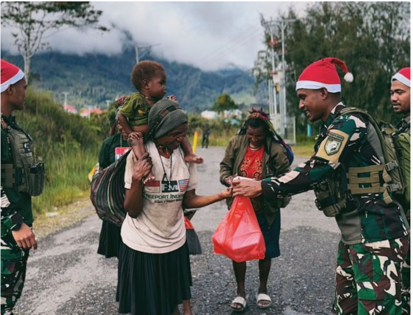
Foto: Satgas Yonif 509 Kostrad memberikan makna baru pada patroli keamanan dengan berbagi kebahagiaan bersama masyarakat di Intan Jaya, Papua.

PAPUA- Dalam balutan semangat Natal yang damai, Satgas Yonif 509 Kostrad